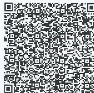
Miçella Rodrigues Escrevente Autorizada

A presente certidão , extraída por processo de digitalização, confere com o documento original registrado sob nº 76 neste Oficial de Registro Civil de Pessoa Jurídica de Chavantes, do que dou fé. Certifico, por fim, que o Registro nº 76 é composto por atos de registro anteriores ao ato objeto da presente certificação, os quais não integram a presente certidão . Chavantes-SP, 20 de maio de 2021. Emolumentos – R$ 12,24; Estado – R$ 3,49; SEFAZ – R$ 2,39; Reg. Civil – R$ 0,66; TJ – R$ 0,85; ISS – R$ 0,43; MP – R$ 0,60; Total – R$ 20,66.